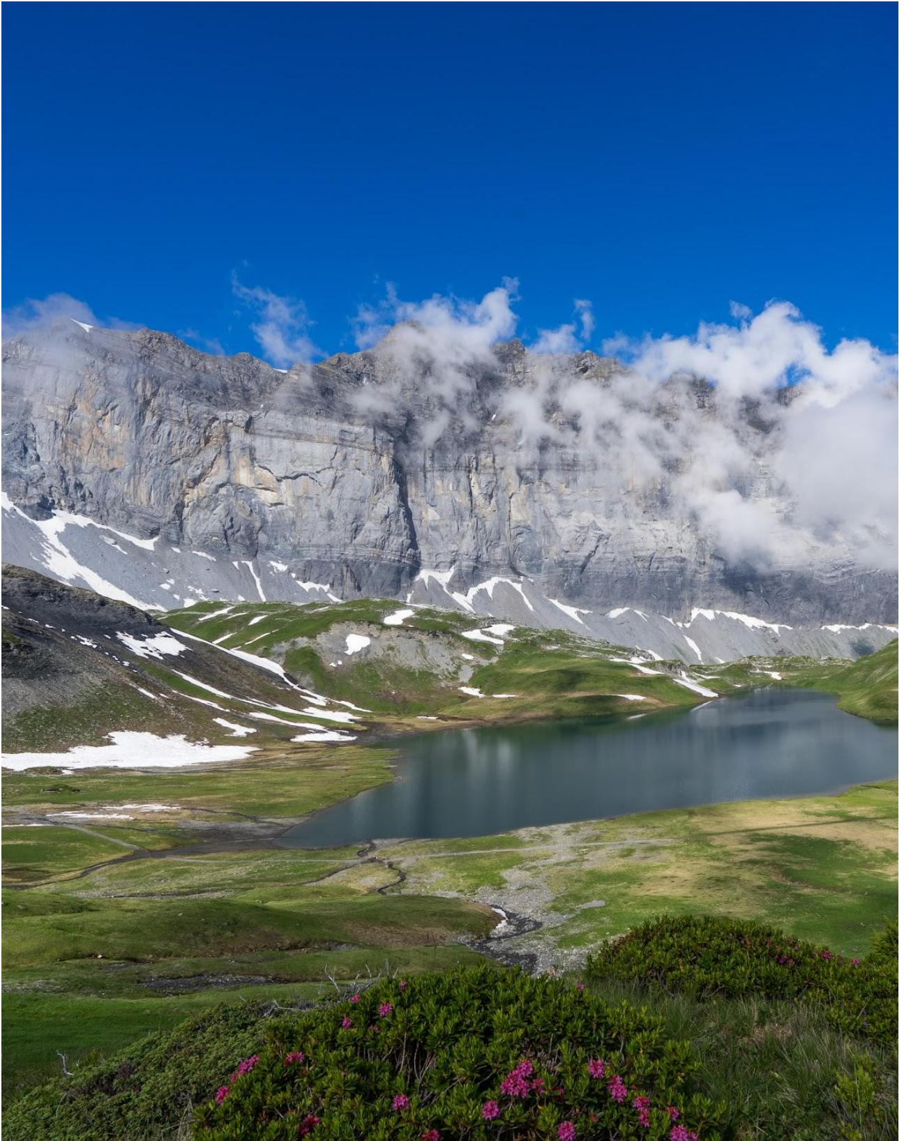
Massif des Fiz et lac d'Anterne