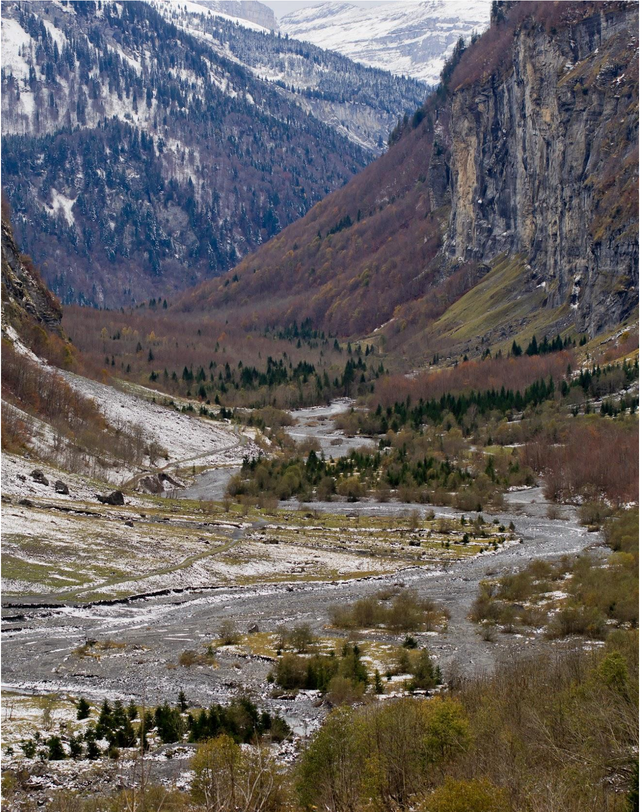
"Bout du monde" en automne